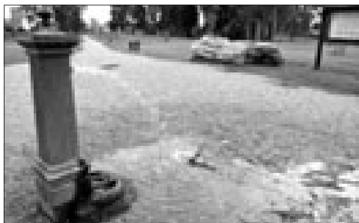
Dalla fontanella sgorga acqua senza sosta da diversi giorni

il fatto agli organi competenti, ma in viale Le Corbusier non si sono visti i tecnici: il rubinetto non è stato riparato, tantomeno nessuno si è preoccupato ma-