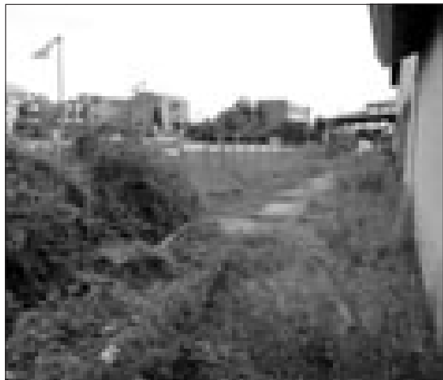
Il degrado del cortile del Consorzio di fronte al parco

L'intervento di Borgo Sabotino, già inserito nel piano triennale delle opere, aveva ricevuto il benestare